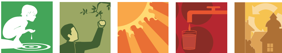
Figur 2 Avfallsplanens mål kopplar till generationsmålet och till de nationella miljö kvalitetsmålen Begränsad klimatpåverkan, Giftfri miljö, Grundvatten av god kvalitet och God bebyggd miljö.

På nationell nivå kopplar avfallsplanens mål till generationsmålet 2 och till de nationella miljö kvalitetsmålen; i första hand Begränsad klimatpåverkan, Giftfri miljö och God bebyggd miljö 3 .