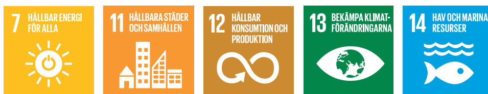
Figur 1 Avfallsplanen har kopplingar till flera av de globala målen.

På en övergripande nivå kopplar avfallsplanens mål till de globala målen Hållbar energi för alla, Hållbara städer och samhällen, Hållbar konsumtion och produktion, Hav och marina resurser, samt Bekämpa klimatförändringar.