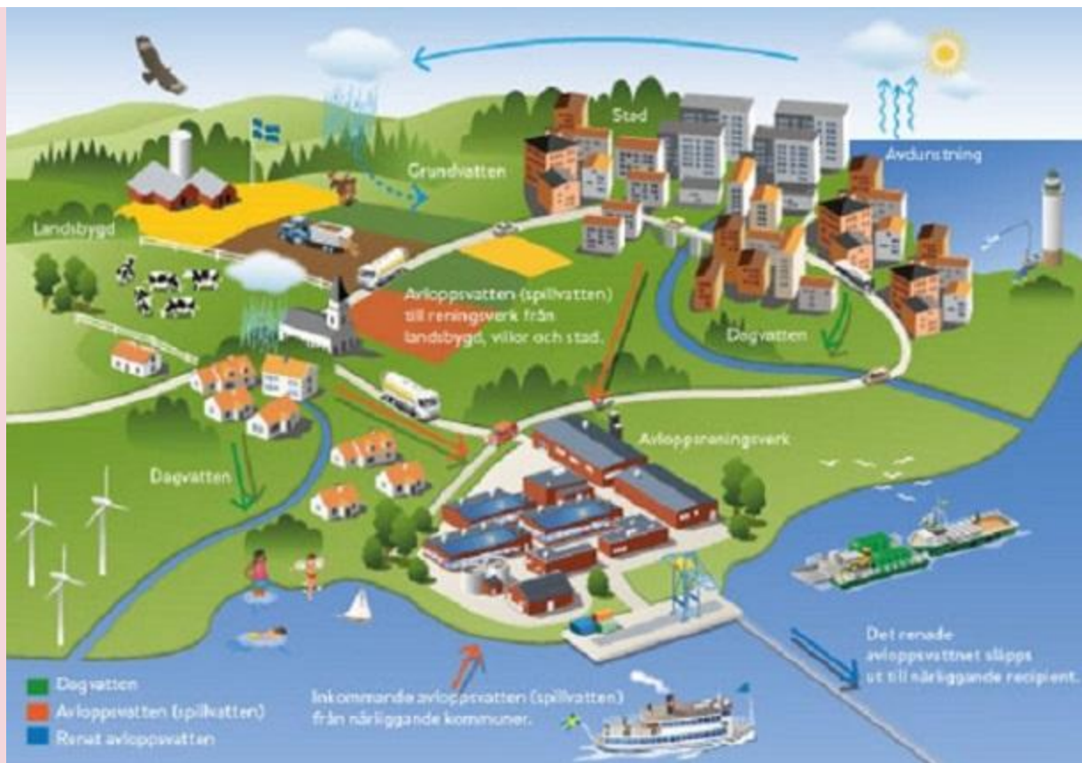
Illustration och exempel på ett avloppsreningsverk.